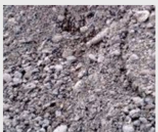
Grave 0/20 recyclée