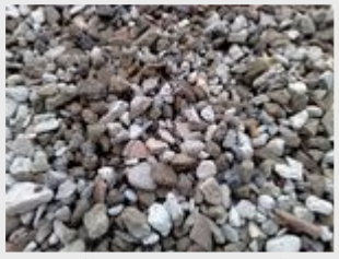
Ballast 30/80 recyclé