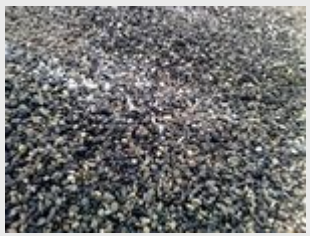
Gravillons à tranchées 5/15 recyclés