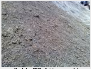
Sable TP 0/4 recyclé