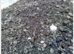
Grave 0/80 recyclée