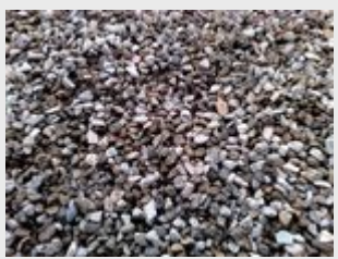
Gravillons 16/22 recyclés